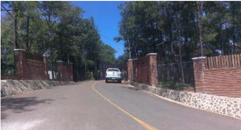
Verja Perimetral y Puerta de Acceso Principal. Complejo Vacacional Ercilía Pepín, Jarabacoa.