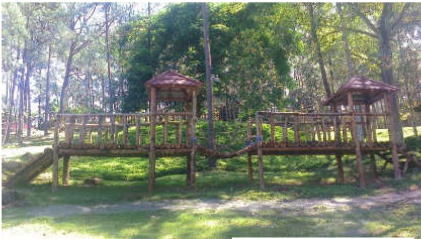
Área de Juego de Niños