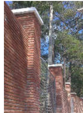
Verja Perimetral y Colindante. Complejo Hotel y Cabaña La Mansión, San José de las Matas