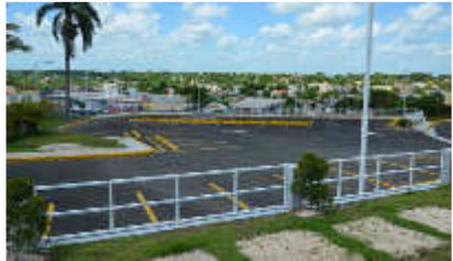
Vista Frontal del Hotel Santa Cruz