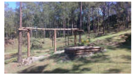
Área de Juego de Niños